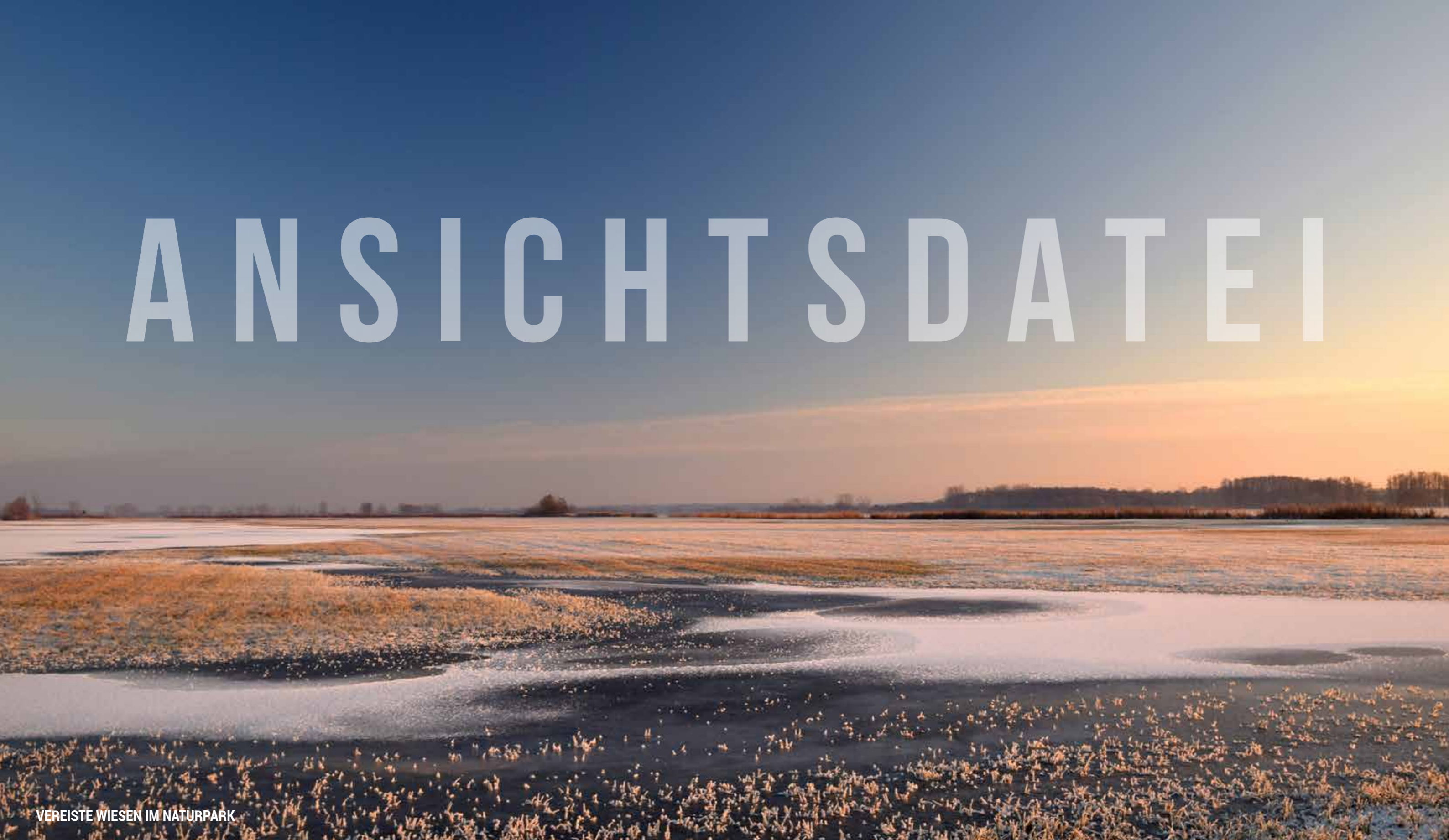
VEREISTE WIESEN IM NATURPARK