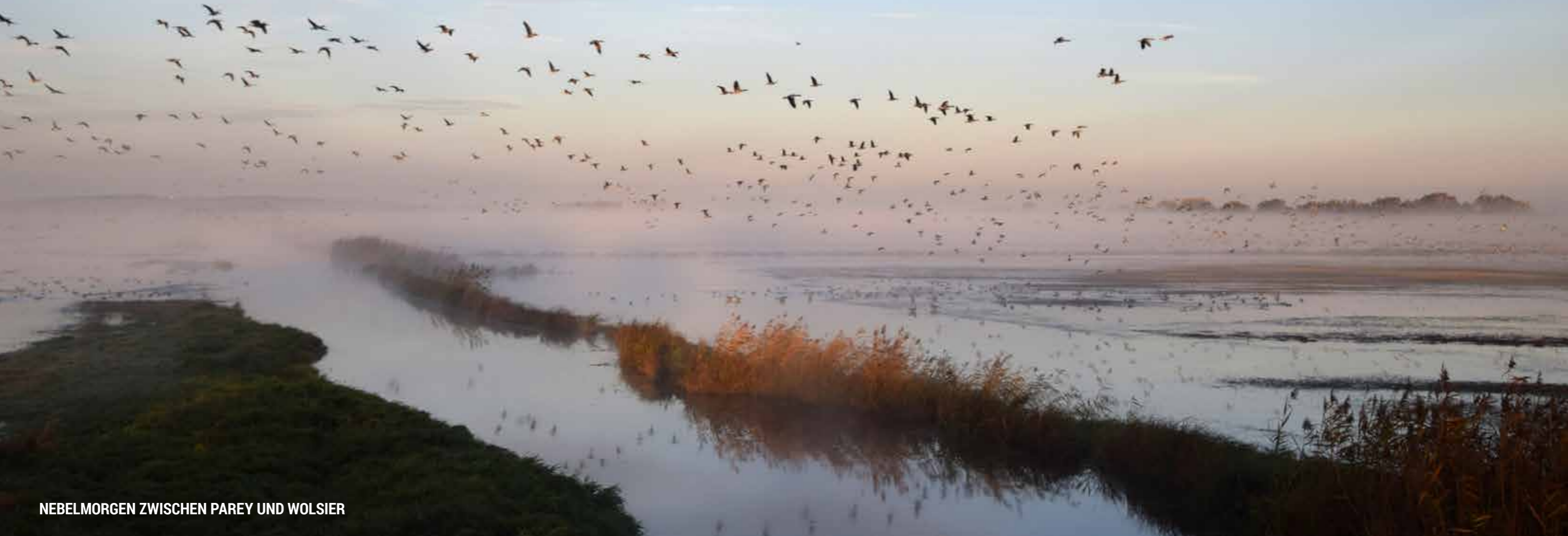
NEBELMORGEN ZWISCHEN PAREY UND WOLSIER