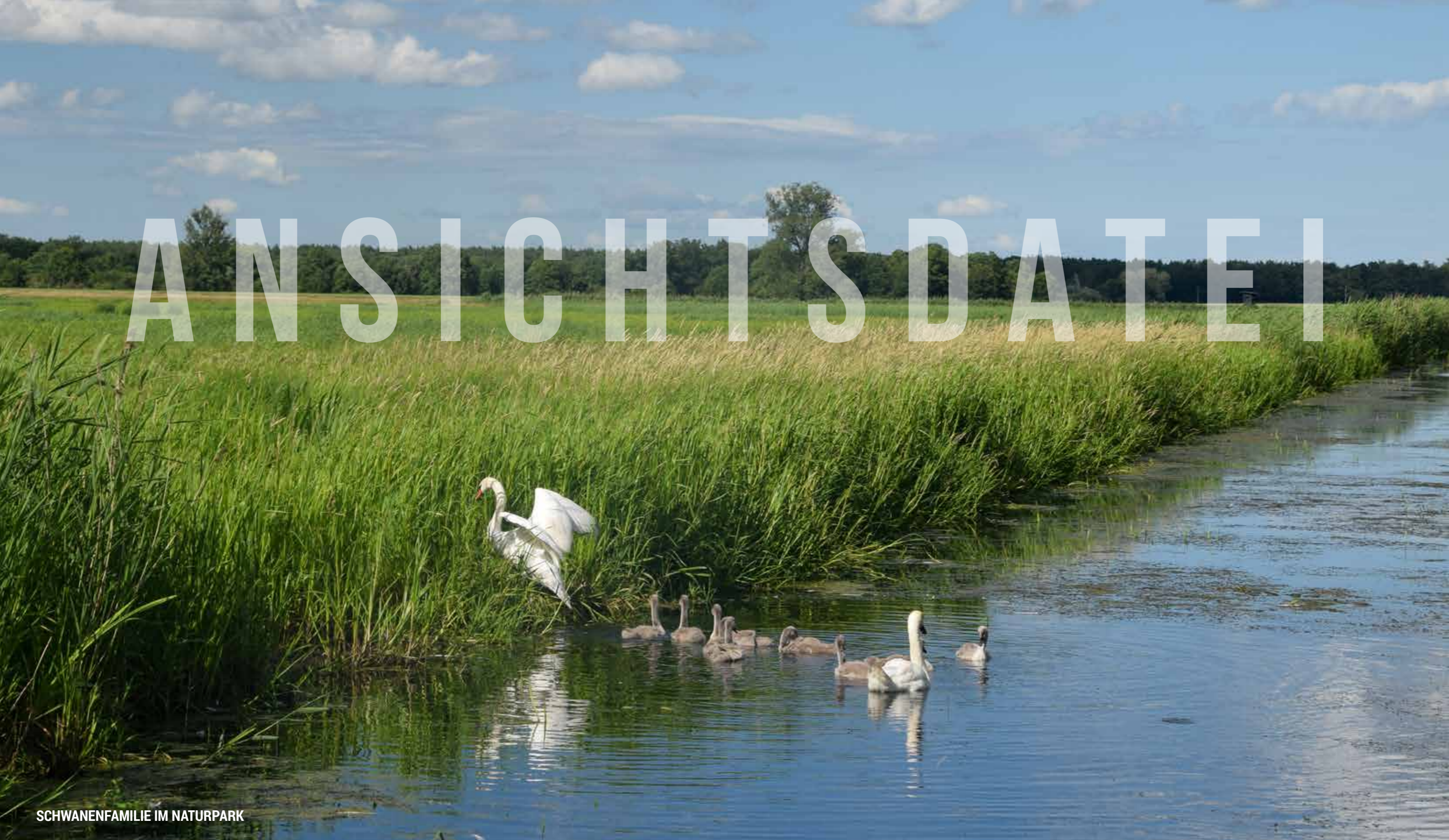
SCHWANENFAMILIE IM NATURPARK