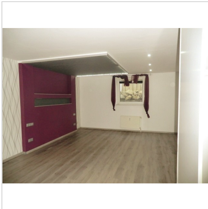
Zimmer Souterrain linke Seite