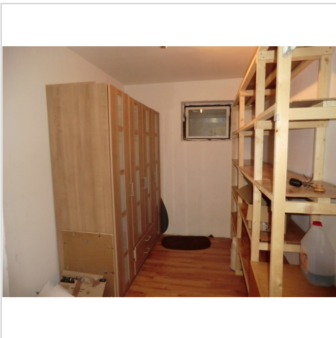
Kellerraum in der Wohnung