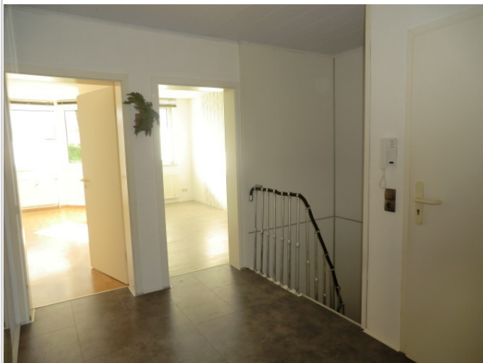
Flur EG mit Treppe ins Soutera