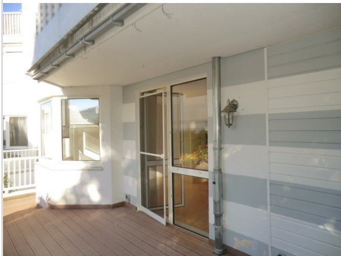
Terrasse Bild 2