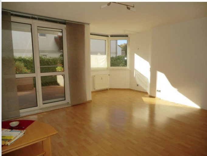
Wohnen-Essen Bild 2