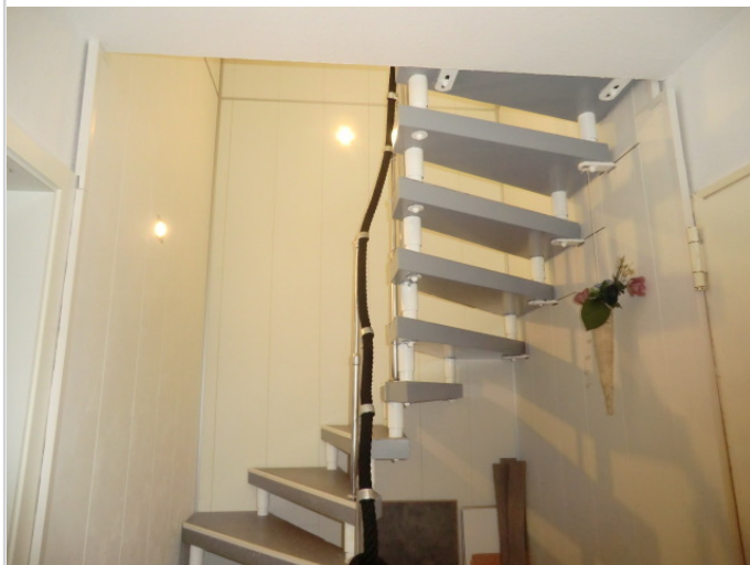
Treppe EG - Souterain