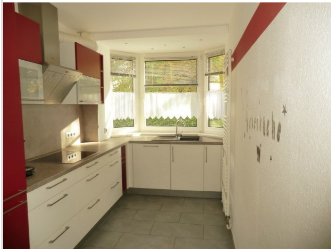
Küche Bild 1