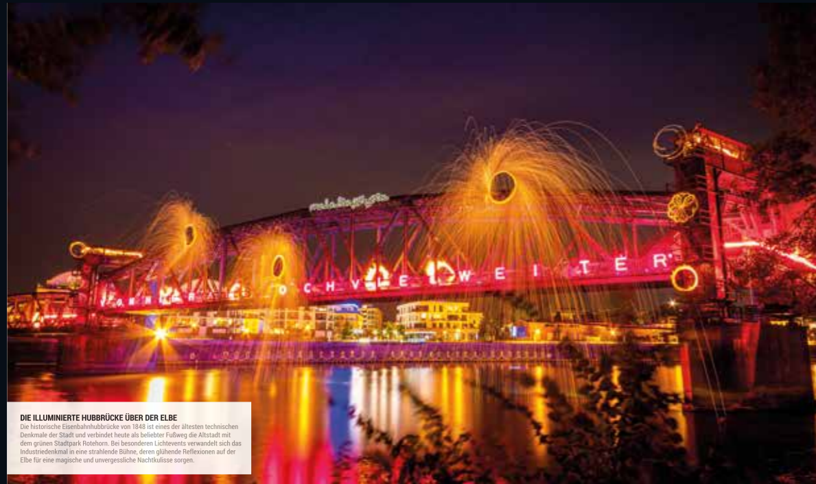
DIE ILLUMINIERTE HUBBRÜCKE ÜBER DER ELBE Die historische Eisenbahnbrücke von 1848 ist eines der ältesten technischen Denkmale der Stadt und verbindet heute als belebter Fußweg die Altstadt mit dem grünen Stadtpark Rotehorn. Bei besonderen Lightevents verwandelt sich das Industriedenkmal in eine strahlende Bühne, deren glühende Reflexionen auf der Elbe für eine magische und unvergessliche Nachtkulisse sorgen.