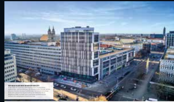
DER NEUE BLAUER BOCK WÄRDEN DER CITY Das neue Bürogebäude am blauen Bock ist ein Wahrzeichen der Magdeburger City. Mit seiner modernen Architektur und nachhaltigen Bauweise setzt es neue Maßstäbe für die Stadtentwicklung.