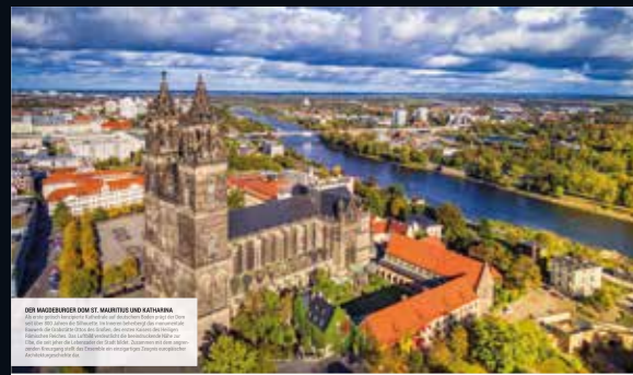
DIE WASSERBOCK UND ST. MARTINUS UND KATHARINA Die Wasserbock in Magdeburg ist ein Wahrzeichen der Stadt. Die historische Kirche St. Martinus und Katharina ist ein weiteres Highlight der Altstadt.