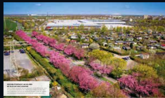
SCHÖNER FRÜHLING AM ELBE MIT BLAUER BOCK UND CO. Im Frühling blühen die Bäume in Magdeburg und die Elbe ist ein Paradies für Spaziergänger. Die frische Luft und die warmen Sonnenstrahlen laden zu langen Spaziergängen ein.