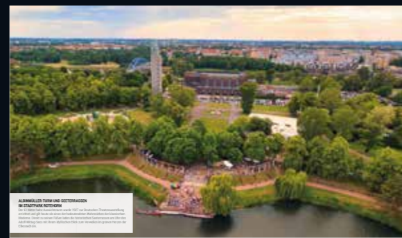
ALTERNATIVER SPAZIERGANG UND BEGRÜNUNG Der alternative Spaziergang durch Magdeburg führt durch grüne Parks und über die Elbe. Die frische Luft und die malerischen Landschaftsbilder sind ein Highlight der Stadt.