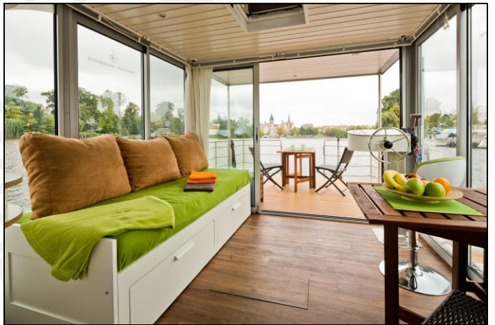
Wohnraum Variante I+II