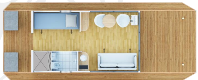
Grundriss Variante II (Sonderausstattung)