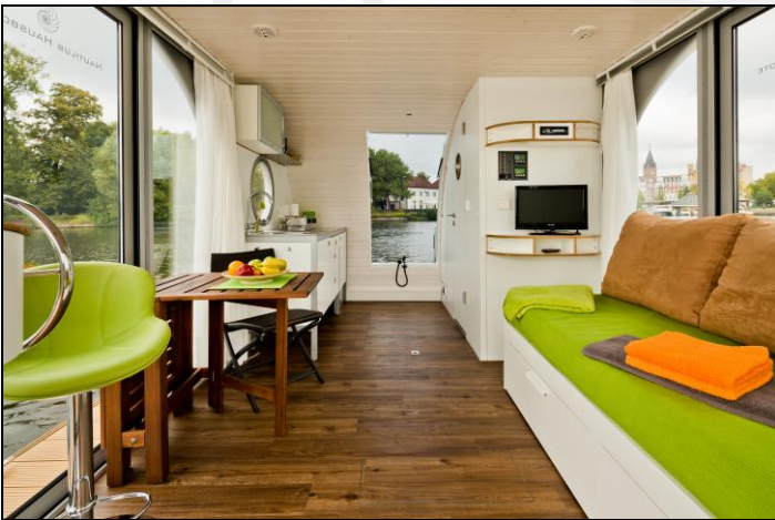
Wohnraum Variante I