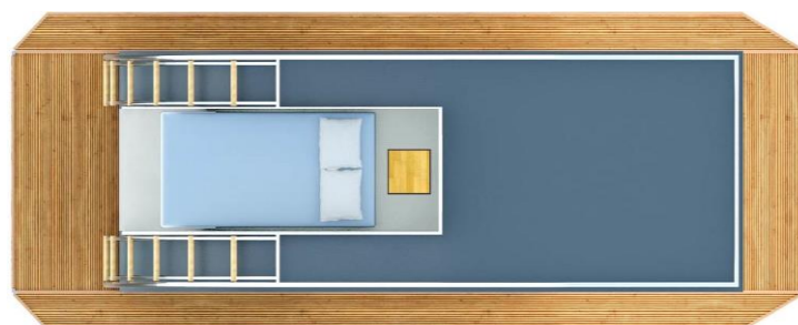
Oberdeck mit Schlafkabine