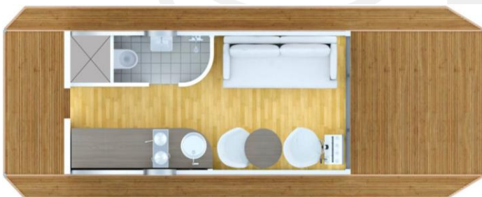
Grundriss Variante I

Weitere Optionen und Sonderwünsche auf Anfrage.