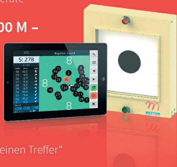
Darstellungen nicht maßstabsgetreu.

⊕ ALLES 100 % BERÜHRUNGSLOS – Die erprobte Technik durch Infrarot misst den „reinen Treffer“ auf der gesamten Fläche