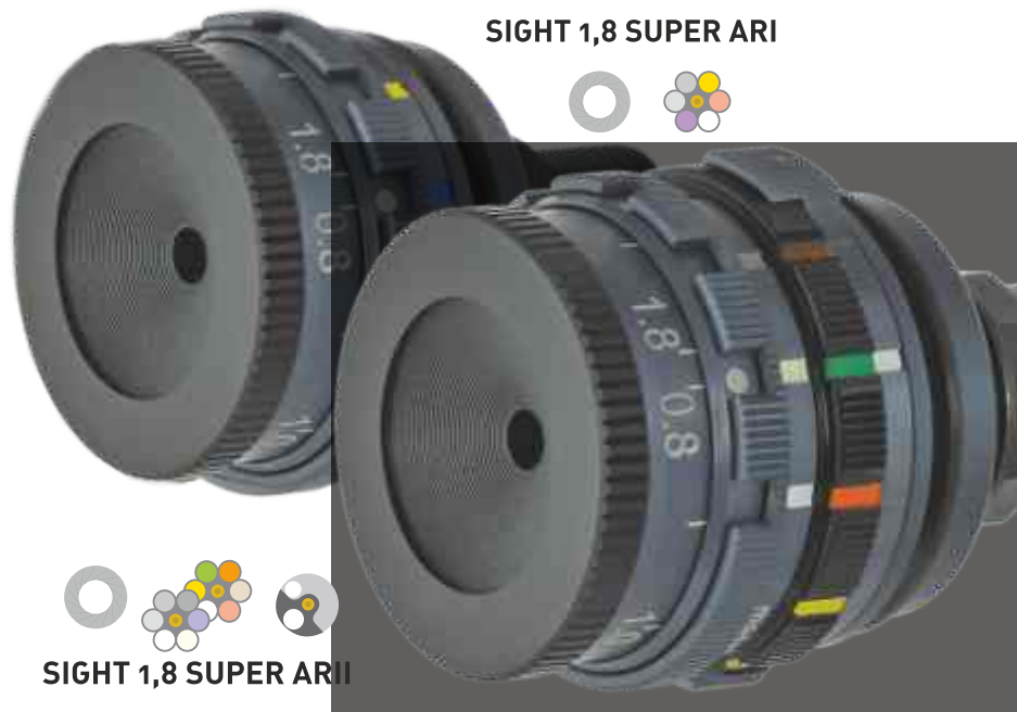
SIGHT 1,8 SUPER ARI