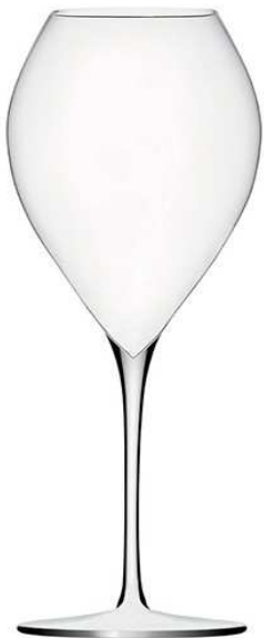
Grand Champagne 45

Preis 40.-€ Stück 6er Set : 230.- € z.Zt. nicht lieferbar