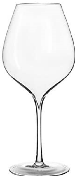
Lallement Nr. 4