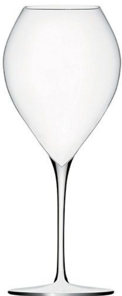
Grand Champagne 45