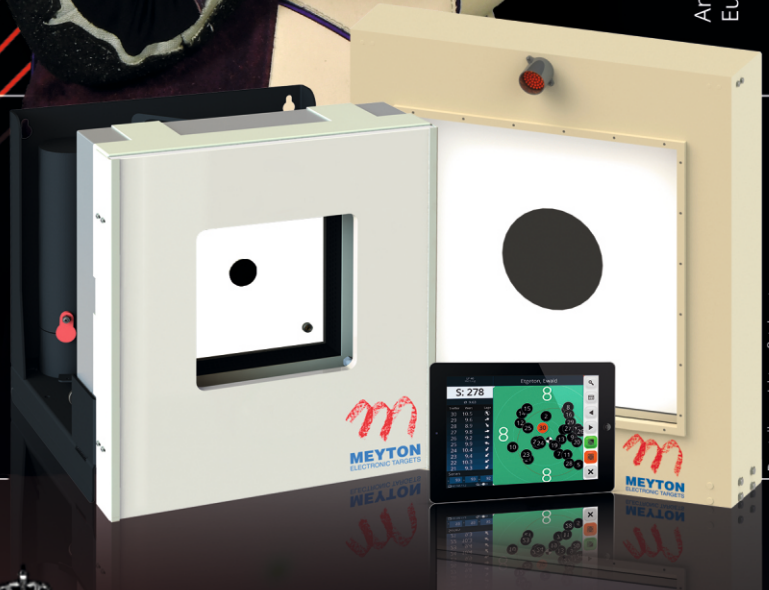
Darstellung nicht maßstabgetreu

MEYTON ANLAGEN STEHEN FÜR HOCHWERTIGE, IN DER INDUSTRIE UND IM PROFISPORT BEWÄHRTE , 100% BERÜHRUNGSLOSE INFRAROT-MESSTECHNIK. UNSCHLAGBAR IN ALLEN DISZIPLINEN VON 10M BIS 100M.